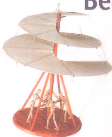
Hier dreht sich was: Zum Beispiel das Modell eines Fluggeräts. Ausprobieren (rechts) ist ausdrücklich erwünscht.